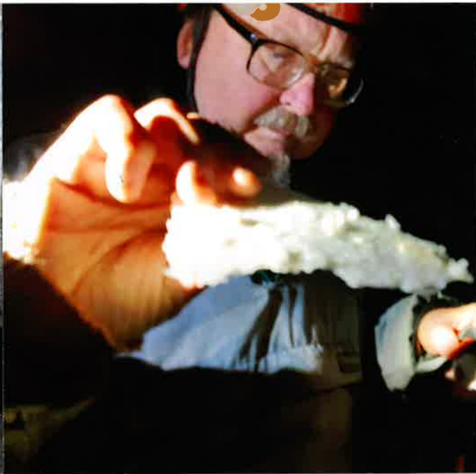
NA SPELEOLOGICKÝ PRŮZKUM z 80.let minulého století lze i dnes navázat..