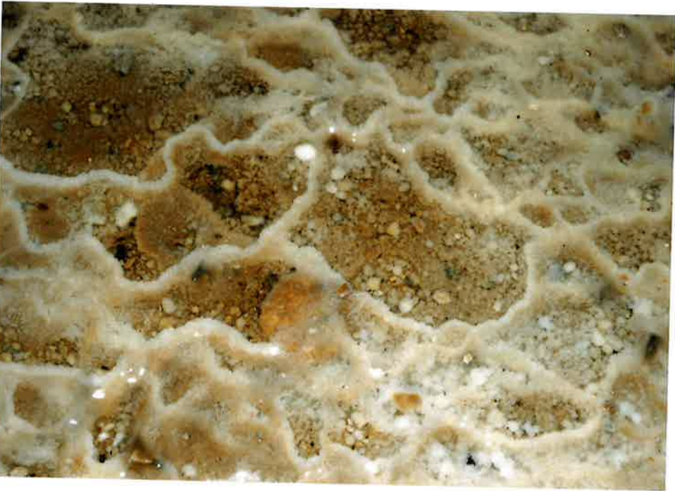
SINTROVÉ HRÁZKY, POVLAKY A JESKYNNÍ PERLY: v přirozeném a UV světle