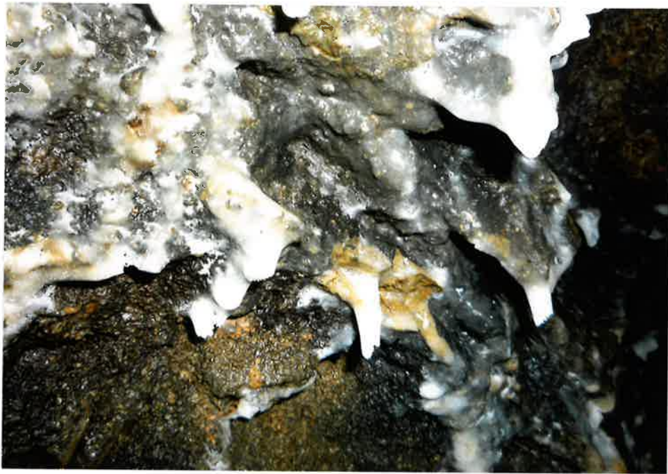
KRASOVÉ JEVY VE ŠTOLE: mladé krápníky, jeskynní perly a unikátní "plovoucí" sintry na hladině jezírek